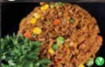
#B2 1 portion