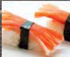
#N2 1 mcx GOBERGE