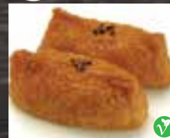
#N10 1 mcx TOFU SUCRÉ