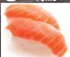
#N7 1 mcx SAUMON FUMÉ