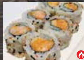
#H3 2 mcx Nori, riz, crevette cuit, mayo épicé, shiracha, tempura