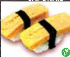
#N9 1 mcx OMELETTE JAPONAIS