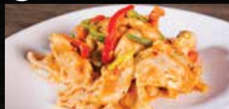
#C4 5-6 mcx