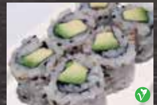
#H4 2 mcx Nori, riz, avocat