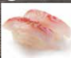
#N8 1 mcx TILAPIA