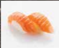
#N1 1 mcx SAUMON