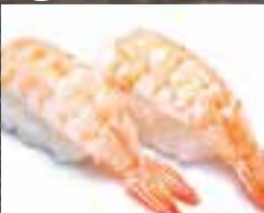
#N4 1 mcx CREVETTE