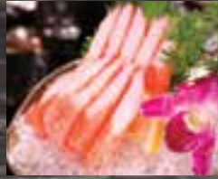
#S2 2 mcx GOBERGE