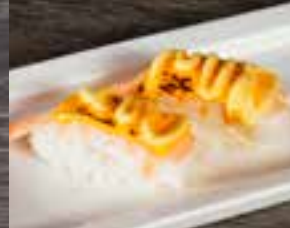
#N13 1 mcx CREVETTE FROMAGE