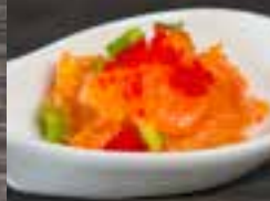
#S11 1 mcx TARTARE DE SAUMON