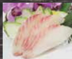
#S3 2 mcx TILAPIA