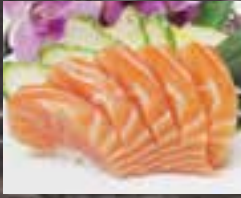
#S1 2 mcx SAUMON